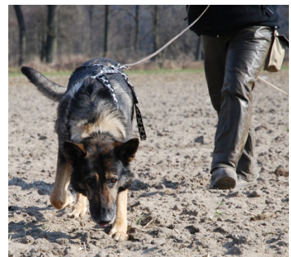
Abb. 10: Lobo bei der Fährtenarbeit – Fremdfährte, ich habe keine Ahnung, wo's langgeht – zusammen finden wir den Weg! Lobo mit der Nase – ich, in dem ich ihm vertraue und ihn „lesen“ kann.

Zusammenkommen ist ein Beginn, Zusammenbleiben ein Fortschritt, Zusammenarbeit ein Erfolg!