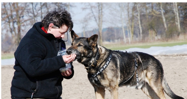
Abb. 9.: Lobo feiert mit mir: gemeinsames „Fressen“ nach gelungener Fährtenarbeit – ein Stück Käse für mich, ein Stück für ihn, dabei noch verbales Lob als Anerkennung