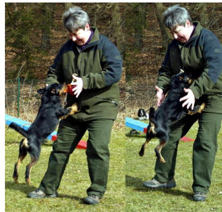
Abb. 8: Pikus kooperiert nach Freigabe: Er hat „Beute“ gemacht und kommt, ohne Hörzeichen (kennt er noch nicht) mit der Beute freiwillig zu mir zurück. „Rammt“ mir seine Beute in den Bauch, Wir feiern beide durch echte Freude von meiner Seite, gemeinsames Spiel und verbale (soziale) Anerkennung für seine Leistung. Warum dies nicht ausbauen? Im Spiel lernen alle Säugetiere den „Ernst des Lebens“ – Spiel ist nichts Verwerfliches, sondern fördert die Bindung und das Vertrauen!!